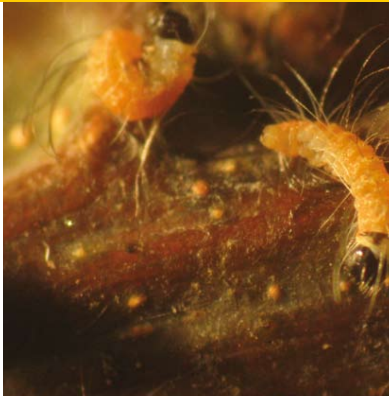
Eikenprocessierupsen door Silvia Hellingman uit het ei gesneden op 31 januari 2009.

en laten zich niet verhongeren. De ontwikkeling van de rups is minimaal en er vindt hooguit één vervelling plaats. Echter, op het moment dat de boom in het blad komt, neemt de rups enorm in omvang toe en vervelt hij vrijwel meteen voor de tweede keer. Zijn jas zit immers heel snel te strak! Vanaf het moment dat de rups de tweede vervelling heeft gehad en hij in het L3-stadium