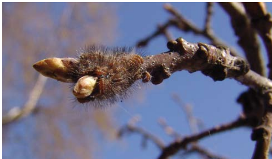
De brandharen van de eikenprocessierups zijn 0,2 tot 0,3 millimeter lang. Elke rups heeft er honderdduizenden tot een miljoen van. Het zijn pijlvormige haren, die bij een bedreiging worden afgeschoten. De haren kunnen dan makkelijk de huid, de ogen en de luchtwegen binnendringen. De stoffen die van de haren afkomen veroorzaken een op allergie lijkende huiduitslag, zwellingen, rode ogen en hevige jeuk, die tot twee weken kan aanhouden.

kent dat de periode van uitlopen onderling sterk verschilt. Er lijkt een synchronisatie aanwezig te zijn tussen het uitlopen van de boom en het uitkomen van de eitjes. De eitjes komen gemiddeld twee tot drie weken eerder uit wanneer de boom is uitgelopen. De rupsen vreten zich in deze bladloze periode in de eindknoppen van de boom in