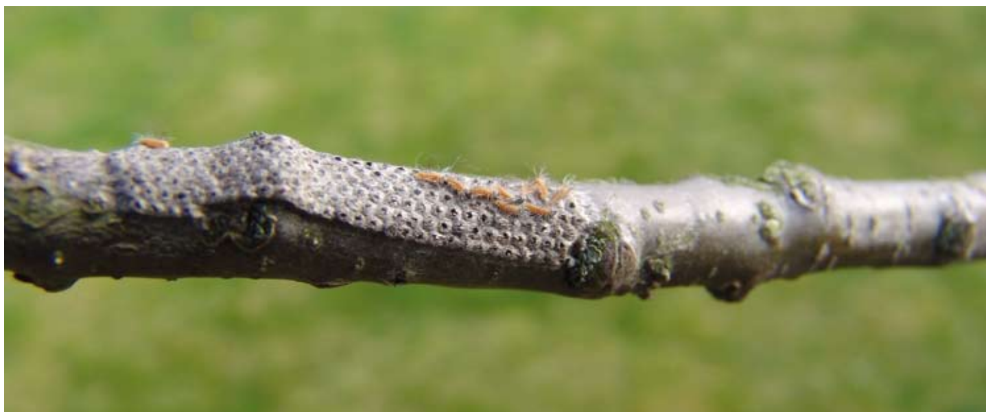
Eikpakket, waarvan enkele uitgekomen eitjes

kunnen de rupsen goed overleven. Als voorbeeld werd in het artikel genoemd dat 1997 ook een terugval kende, aangezien in januari van dat jaar een elfstedentocht is verreden en de gemiddelde temperatuur toen min 7 graden Celsius is geweest. Mijn overtuiging is dat juist de periode van april tot mei hierin bepalend is geweest. Het was toen in april koud en in mei is 115 millimeter