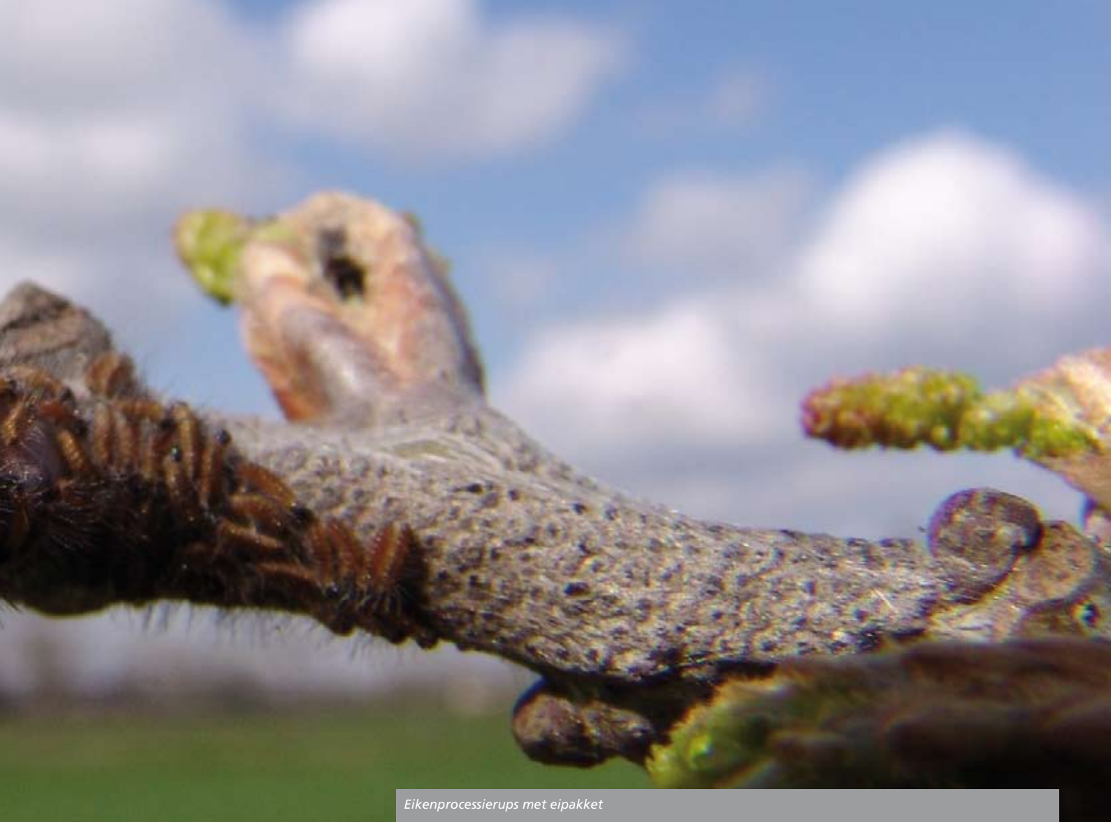
Eikenprocessierups met eipakket